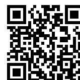
連絡メール2 保護者ログイン

* 保護者登録しているメールアドレスがご利用できない場合は、パスワードの再設定ができません。